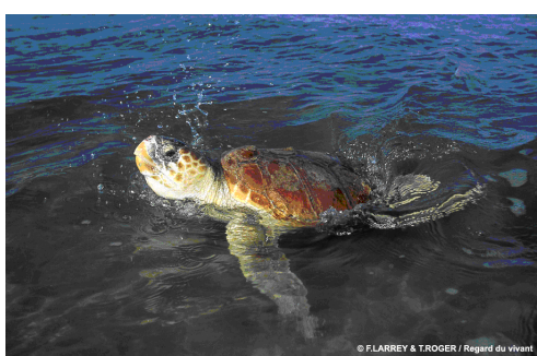
Tortue Caouanne (Regard du vivant)