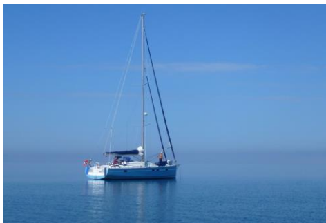
Plaisancier à Beauduc (DREAL PACA)