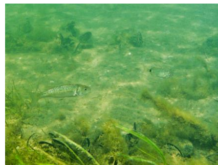
Juveniles de loup et de sar (PNRC)

La gestion de ces sites a donné lieu à plusieurs conventions de partenariat (GIS Posidonie/M.I.O, Phares et Balises, Prud'homie de Pêche) et d'autres sont à venir (Agence des Aires marines protégées, SDIS 13...).