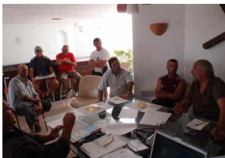
Concertation avec pêcheurs professionnels (PNRC)

Suite à la demande des pêcheurs professionnels en 2004, le Parc a travaillé à la création d'une réserve marine dans le golfe de Beauduc. L'objectif principal est de restaurer cette zone de nurserie pour poissons plats après des années de passage illégal des arts traînants en créant une « zone abri » dont l'action se fera ressentir à terme bien au-delà de la réserve pour le bénéfice de la biodiversité comme de la pêche. Après plusieurs études de connaissance et de faisabilité, la concertation avec les pêcheurs professionnels et l'ensemble des acteurs concernés (2009-10) a permis d'établir les choix d'emplacement et de gestion. Associés très tôt au processus, les plaisanciers sont aussi des partenaires privilégiés pour le Parc, grâce à leurs actions de sensibilisation, leurs observations et leur contribution à la concertation.