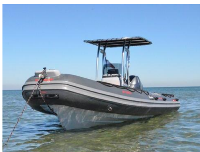
Bateau du Parc de Camargue