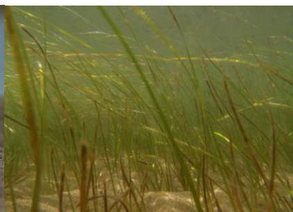
Herbier de zostères naines (PNRC)