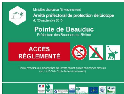
Panneau signalétique (PNRC)