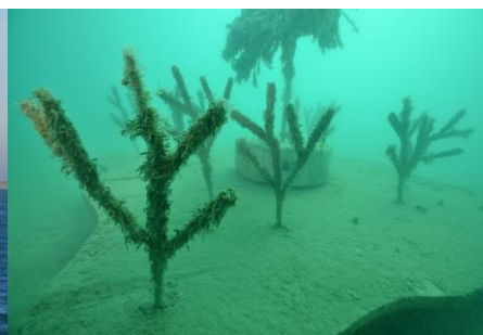
Dispositif de nurserie artificielle