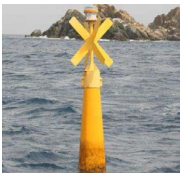
Marque spéciale, croix de St André

Le Parc naturel régional de Camargue a établi une convention avec Phares et Balises (DIRM) pour l'installation, la location et l'entretien de 6 balises de marque spéciale, à flotteur immergé, avec une croix de St André (jaunes).